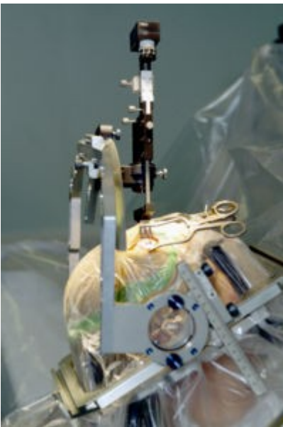
Stereotaxiegerät zur Platzierung einer Stimulationselektrode

Seit Jahren werden auch chirurgische Behandlungsmöglichkeiten eingesetzt. Eine sehr erfolgreiche Methode ist die Tiefe Hirnstimulation, bei der dem Patienten ein „Hirnschrittmacher“ eingesetzt wird. Er sendet über dünne Drähte elektrische Impulse in die Hirnregionen Nucleus subthalamicus und Globus pallidus, die überaktive Fehlimpulse unterdrücken. Dieses Verfahren kommt bei schweren Parkinson-Syndromen, daneben aber auch Dyskinesien in Frage, wenn die medikamentöse Therapie ihre Grenzen erreicht hat.