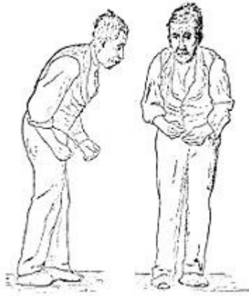
Körperhaltung eines Mannes mit Parkinson-Syndrom (Zeichnung von William Richard Gowers 1886)

Diese allgemeine Bewegungsarmut ist Voraussetzung für die Diagnose eines Parkinson-Syndroms. Sie macht sich bei allen Bewegungen bemerkbar. So vermindert sich das Muskelspiel, was den Gesichtsausdruck bestimmt (Maskengesicht, Hypomimie), das Sprechen wird leise und undeutlich (Mikrophonie), das Schlucken verzögert sich (scheinbar vermehrter Speichelfluss - Pseudohypersalivation), die Geschicklichkeit der Hände lässt besonders bei schnellen Bewegungen nach (Schriftbild wird kleiner - Mikrographie), die Rumpfbewegungen sind erschwert (vermindertes Umlagern im Schlaf), das Gangbild wird kleinschrittig und schlurfend.